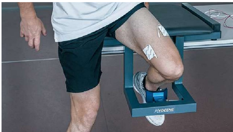
La mesure s'effectue sur le quadriceps, un muscle sollicité dans une large gamme de sports.

« Une séance de deux minutes et quarante-huit mesures suffisent à déterminer avec une grande précision l'état de fatigue du quadriceps de l'athlète. »